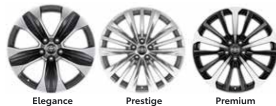
Elegance Prestige Premium