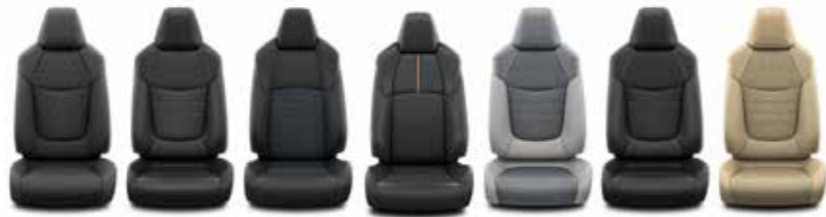
Live/Active Lounge Style Adventure Premium Premium Premium