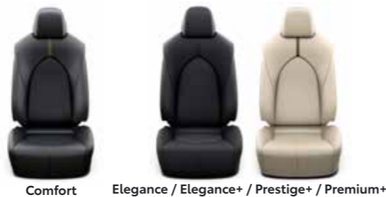
Comfort Elegance / Elegance+ / Prestige+ / Premium+