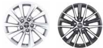
Comfort / Elegance+ / Elegance+ Prestige+ / Premium+