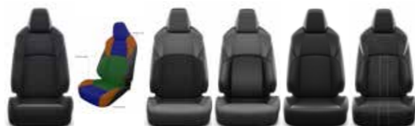
Live Active Lounge Premium Premium GR Sport