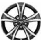
Active / Lounge / Premium