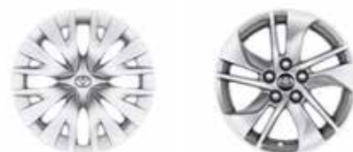
Live / Active Elegant / Elegant+ / Style / Style+