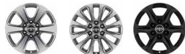
Elegance / Prestige 3.3 Prestige 3.5 / Premium GR SPORT