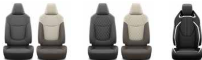
City City Live, Active, Style GR Sport