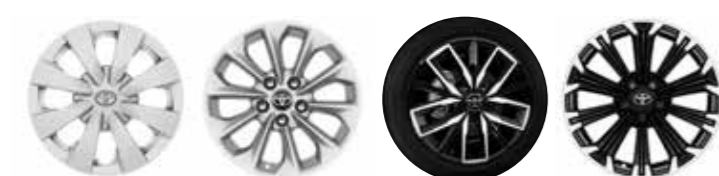
City / Live Active Style GR Sport