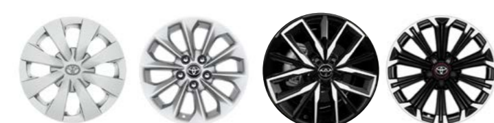
City / Live Active Style GR Sport