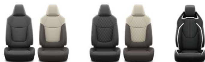
City City Live, Active, Style GR Sport