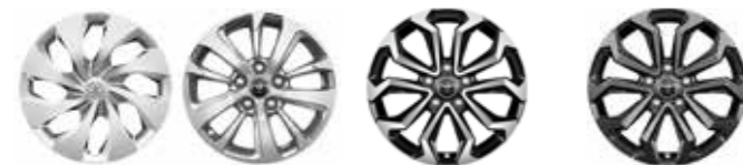
Live Active Lounge / Urban / Elegant Style / Adventure