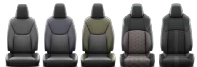
Live / Active / Lounge Urban Style Elegant Adventure