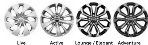
Live Active Lounge / Elegant Adventure