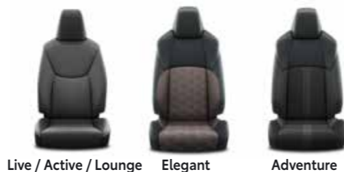
Live / Active / Lounge Elegant Adventure