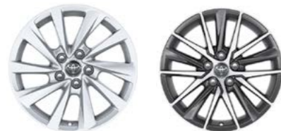
Comfort / Elegance / Elegance+ Prestige+ / Premium+