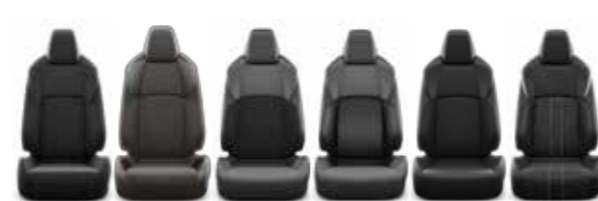
Live Active Lounge Premium Premium GR Sport