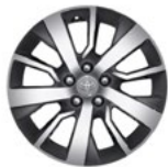
Comfort / Prestige / Premium